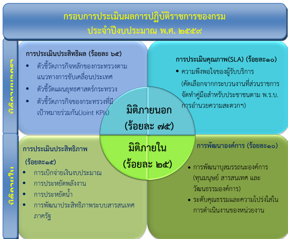
แผนภาพที่ ๑ - ๑ กรอบการประเมินผลการปฏิบัติราชการของส่วนราชการ

สำหรับประเด็นการประเมินผลการปฏิบัติราชการระดับกระทรวงหรือส่วนราชการระดับกรม สำนักงาน ก.พ.ร. ดำเนินการ ๑) ให้ส่วนราชการเสนอตัวชี้วัดตามกรอบการประเมินผล (เฉพาะด้านประสิทธิผล ) ได้แก่ ๑) นโยบาย ประเด็น ยุทธศาสตร์ และเป้าประสงค์ของรัฐบาลที่มอบให้แต่ละส่วนราชการรับไปดำเนินการ ๒) ภารกิจของส่วนราชการตามแผน ยุทธศาสตร์หรือแผนปฏิบัติราชการประจำปี ๓) ภารกิจบูรณาการร่วมระหว่างกระทรวงเพื่อให้การติดตามและประเมินผล ภาครัฐ ให้มีความเป็นเอกภาพ ลดความซ้ำซ้อนและภาระงานเอกสาร มุ่งเน้นเฉพาะตัวชี้วัดหลักที่มีความจำเป็นในแต่ละปี สำหรับในปีงบประมาณ พ.ศ. ๒๕๕๙ ได้กำหนดกรอบการประเมินผลการปฏิบัติราชการระดับกรมไว้ดังนี้ (สำหรับสำนักงานตำรวจแห่งชาติ)